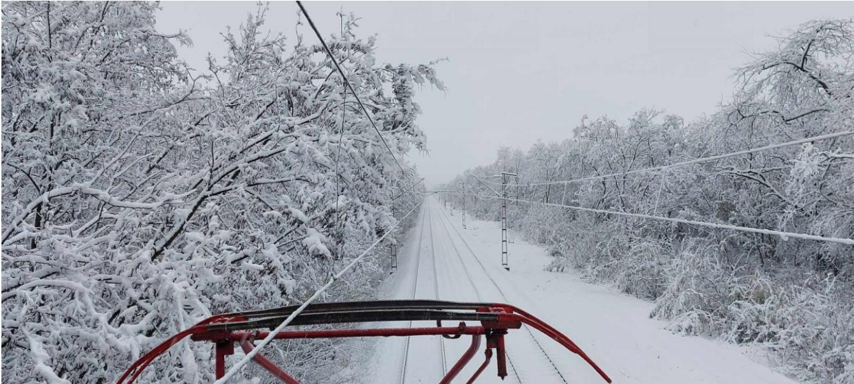
2. kép: Emőd és Mezőkeresztes-Mezőnyárad állomások között a rendkívüli időjárás miatt az úrszelvénybe belógó faágak az 5019 sz. vonat áramszedőtörését okozták 2024.11.22.