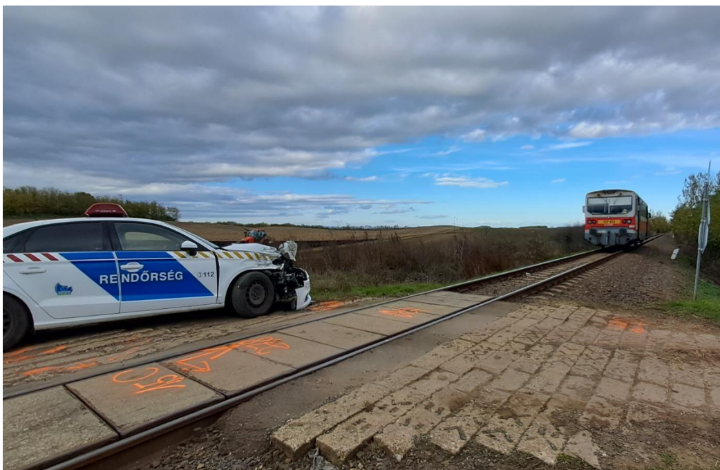
3. kép: Vasúti átjáróban bekövetkezett baleset Tiszalök és Görögzállás állomások között 2024.11.02.

A balesetek személyi következményei: személyi sérülés nem történt.