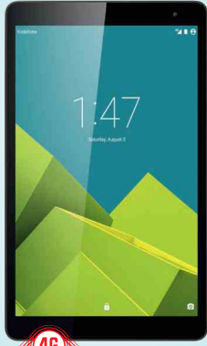
Vodafone Tab Prime 10"