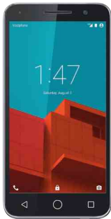
Vodafone Smart Prime 6 990 Ft

Ha készüléket is szeretnél, az alábbi kedvezményes kínálatunkból választhatsz!