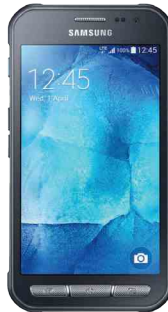
Samsung Xcover 3 (4G) 6 990 Ft

1 GB-os belföldi adatopcióval új, 2 éves flotta- előfizetéssel, flotta igazolással