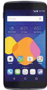
Alcatel IDOL 3 1 Ft

2 GB-os belföldi adatopcióval új, 2 éves flotta- előfizetéssel, flotta igazolással