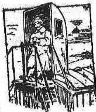
Ott gubbasztanak „szelős” fák-bódájukban.

Indulás előtt számbaveszi a kocsikat, kijelöli minden egyes vonat fekezőjének a helyét (amelyet elhagynia vagy fölcserlennie csak a vonatvezető engedélyével szabad).