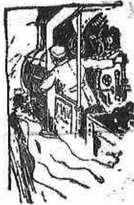
Figyeli a pályatester...

Bizonyára akadnak, akik ennél sokkalta érdekesebbnek találják a divatlapot, mozik vagy a