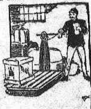
A főjévedelmet a gyors- és teherszállítás adja.

Azt azonban most mindjárt megjegyzem, hogy a személyszállítás a vasút vállalatoknak kisebb fontosságú üzlet-