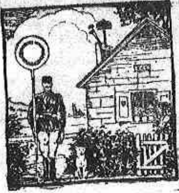
Ott áll a háziakja előtt...

retettel a velünk együtt „utazókat”. Vegyük tudomásul az érdekünkben dolgozók munkáját s fizessünk érte pénzen kívül lélekkel. A kétségek ködéből előcsillanó kereszt átható fénye mellett nézünk az emberben a felebarátot, akit épp úgy kell szeretnünk, mint saját magunkat. Az élet gondját, bűjét pedig mérgeassuk mindig az örök-kévalóság perspektívájában.