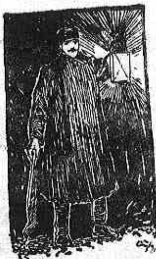
Éjjeli lámpáikkal látogatnak.

A vonatkísérő csapat „parancsnoka” a vonatvezető, legénysége a fekezők (személyvonatoknál a kalauzok). A vonatvezető képviseli a vasútigazgatóságot a vonaton menetközben. (A mozdonyvezető kizárólag a gépet kezeli.) A vonatvezetőnek az ún. podgyászokocsiban