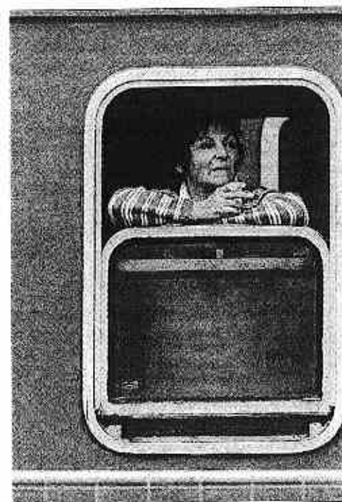
...írásigolthatják a szabálysértőket

Magyarországon is tilos rágyújtani a vasúti szerelvényeken